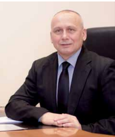
Советник губернатора Тверской области, Уполномоченный по правам человека в Тверской области в 2012–2016 гг.

Правительство Тверской области рассчитывает, что успешное взаимодействие органов власти с институтом Уполномоченного по правам человека будет и впредь способствовать укреплению законности в нашем регионе, повышению качества жизни населения.