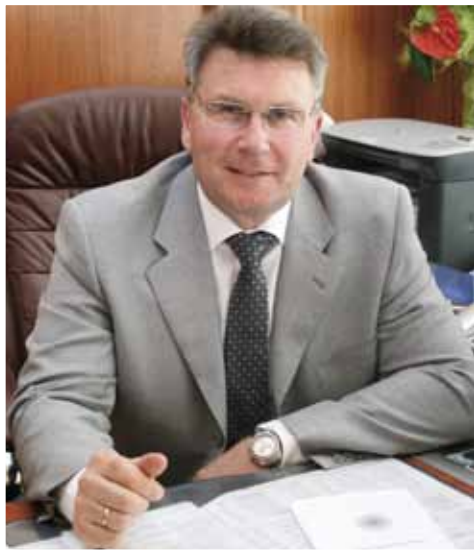
Заместитель Председателя Правительства Тверской области

В 2007 году начался отсчёт деятельности Уполномоченного по правам человека в Тверской области. Прошедшее десятилетие вместило значимые начинания и проекты, направленные на оказание эффективной помощи жителям, решение самых актуальных вопросов. Среди них