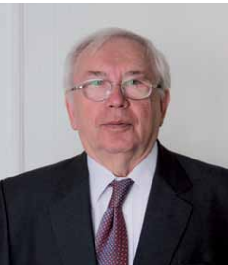
Член Совета Федерации Федерального Собрания Российской Федерации Владимир Лукин

Я очень рад вновь оказаться на тверской земле, тем более по такому хорошему поводу. 10 лет региональному институту Уполномоченного по правам человека. С одной стороны, совсем немного, с другой – целая вереница человеческих судеб, проблем, решённых и нерешённых вопросов. Это тот рубеж, когда можно оглянуться и подвести некоторые итоги.