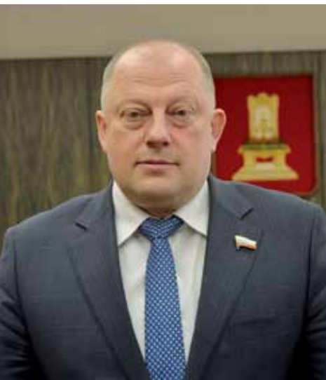
Председатель Законодательного Собрания Тверской области Сергей Голубев